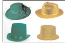
des coiffes vertes et dorées

Mais il eût pu, en toute correction grammaticale, écrire " Les plantes vert et or ". Quelle différence entre les deux orthographes ? Voici :