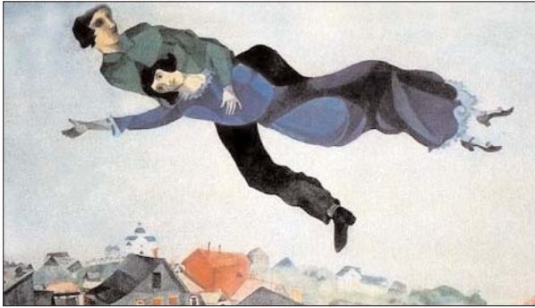
Marc Chagall «Over the town» 1918