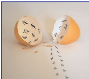
Confinement Ch. Conrardy